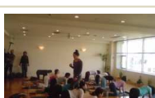
父母トレーナー養成