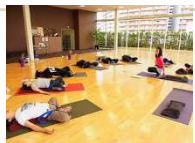
親子スポーツ教室