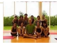
和のプログラム開発

4歳～10歳の子どもと親御さんが共に通う親子スポーツ教室。親子で共にワークをするだけでなく、親子をシャッフルしてワークを積み重ねていくことで子ども好きの親御さんを増やしていきます。運動にうんざりしてる子ども走るのを好きに、スポーツ素人の親御さんでも子どもが本格的にスポーツをはじめる前に指導に大事なメソッドを習得できます。